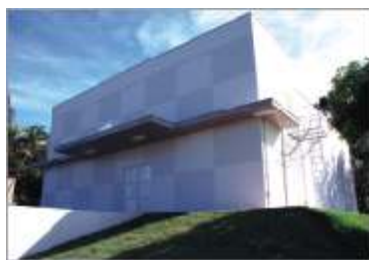
Centro de Experimentação Animal (Bloco E)