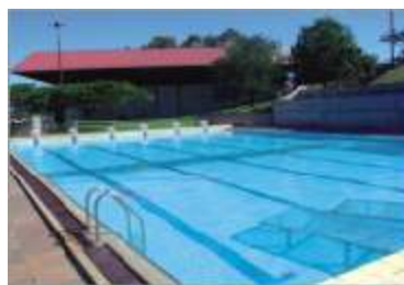
Conjunto Poli-Esportivo (Bloco D)

Nas próximas edições, por meio desta coluna, você conhecerá, com detalhes, toda a história da UNIARARAS. Fique atento!