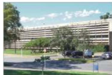
Prédio central (bloco A)

O Centro Universitário Hermínio Ometto - Uniararas é uma instituição de ensino superior privada, sem fins lucrativos, com uma história escrita desde 1973, por seu fundador Hermínio Ometto. Nesses quase 40 anos, o Centro Universitário, mantido pela Fundação Hermínio Ometto, espalhou-se por 170 mil m 2 , através de seu campus, que conta com um patrimônio de 5.500 árvores nativas brasileiras. Seus mais de 37 mil m 2 de área construída abrigam salas de aula, laboratórios específicos e multidisciplinares, clínicas, auditórios, salas de atividades administrativas, biblioteca e restaurante. Atualmente, a Uniararas oferece cursos de graduação nas áreas de saúde, educação, humanas, tecnologia e engenharias, cursos de pós-graduação lato sensu e um curso de mestrado reconhecido pela CAPES. Além de continuar ampliando sua estrutura, oferecendo novas opções de cursos e se solidificando como centro de investigação científica e pólo universitário, a Uniararas está acessível em outras cidades, oferecendo todo o seu potencial científico e qualidade de ensino em cursos a distância, acompanhando de perto a evolução da educação no Brasil e no mundo.